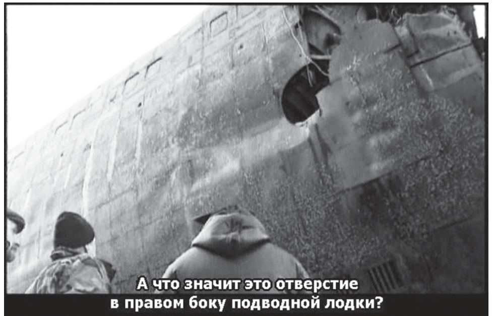
А что значит это отверстие в правом боку подводной лодки?